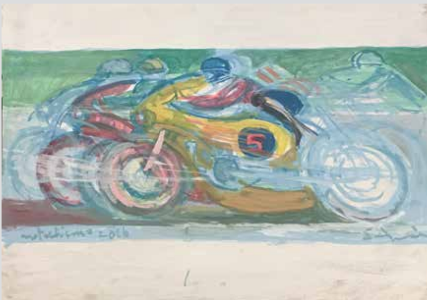
Motociklizam / Motociclismo, 2016, 70 x 80