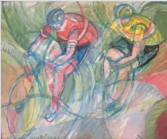
Biciklisti / Ciclisti, 2002/2003, 80 x 70