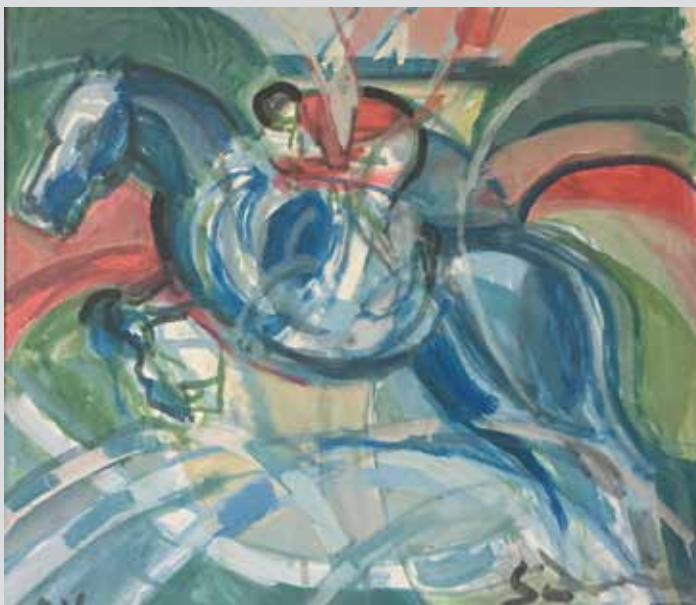
Jahanje / Equitazione, 2016, 44 X 39