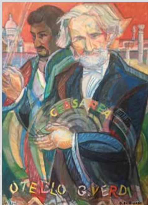
Omaž Verdiju, Otelo, Izraelska opera / Omaggio a Verdi Otello Israeli Opera, 2001, 50,4 x 65