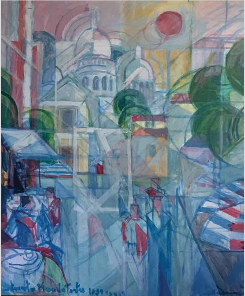
Monmartr, Trg Tertr / Montmartre, Place du Tertre, 1999/2009, 80 x 70