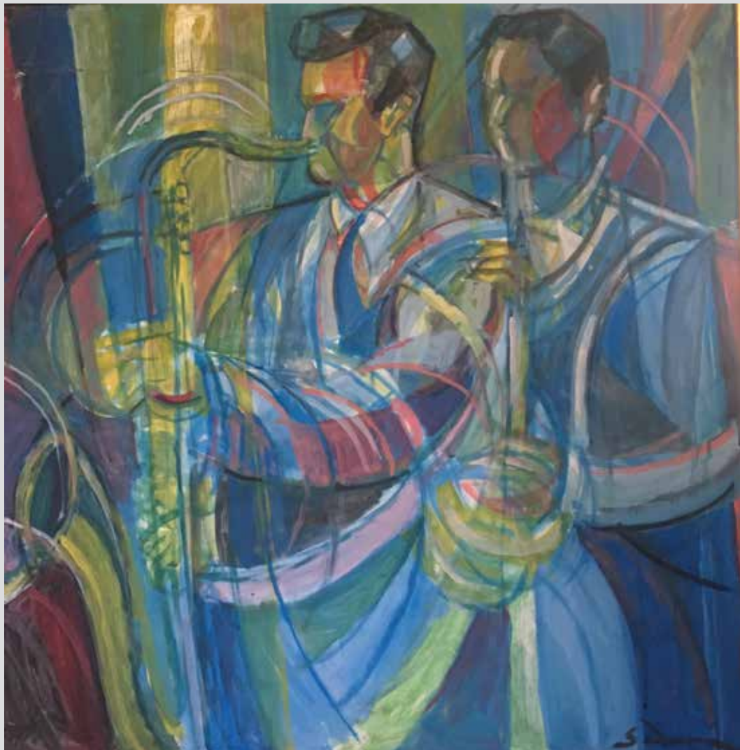
Džez / II Jazz, 2007-2009, 80 x 80