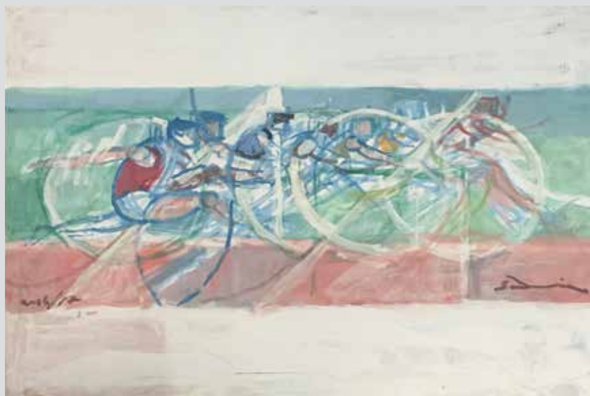
Trka s preponama / Salto ad Ostacoli, 2016/2017, 65 x 80