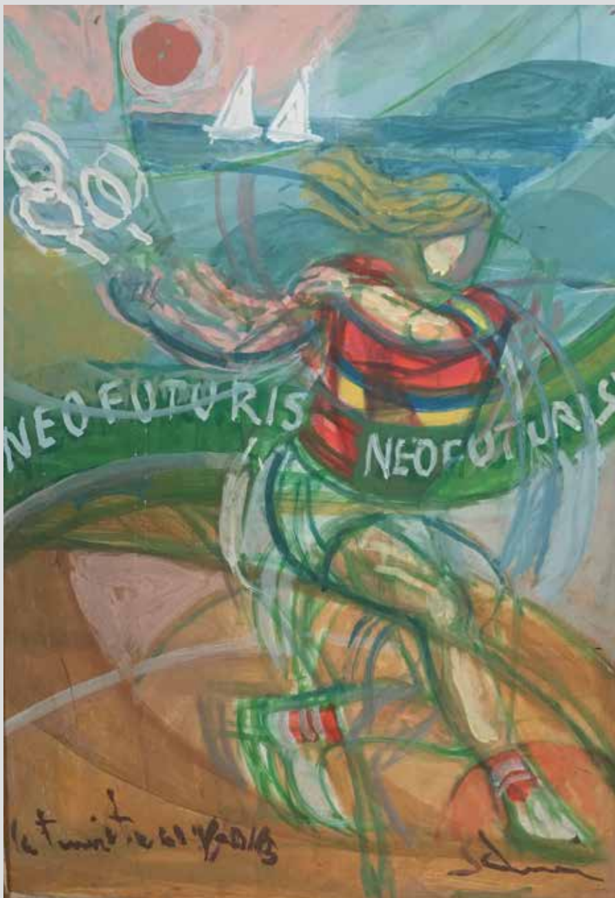
Teniserka / La tennista, 2011/2016, 80 x 50