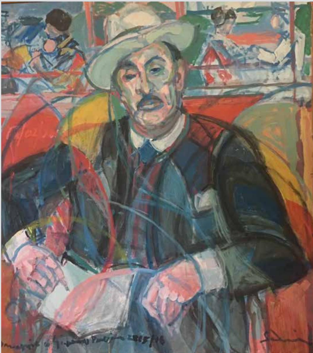
Veliki Pučini / Puccini Grande, 2015/2016, 80 x 80