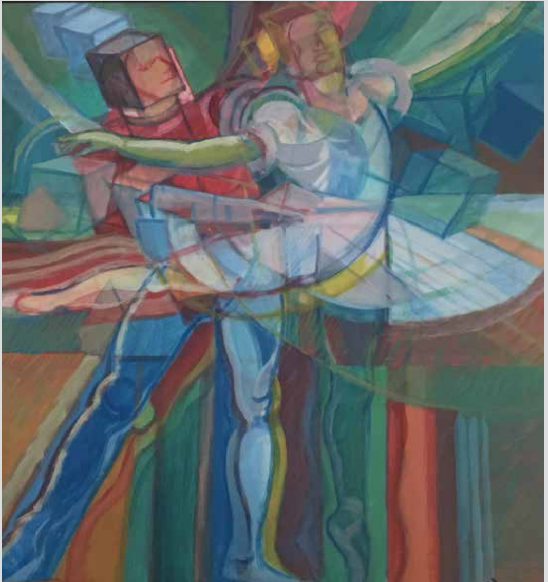
Balet / Balletto, 1995 -1998, 70 x 74,5