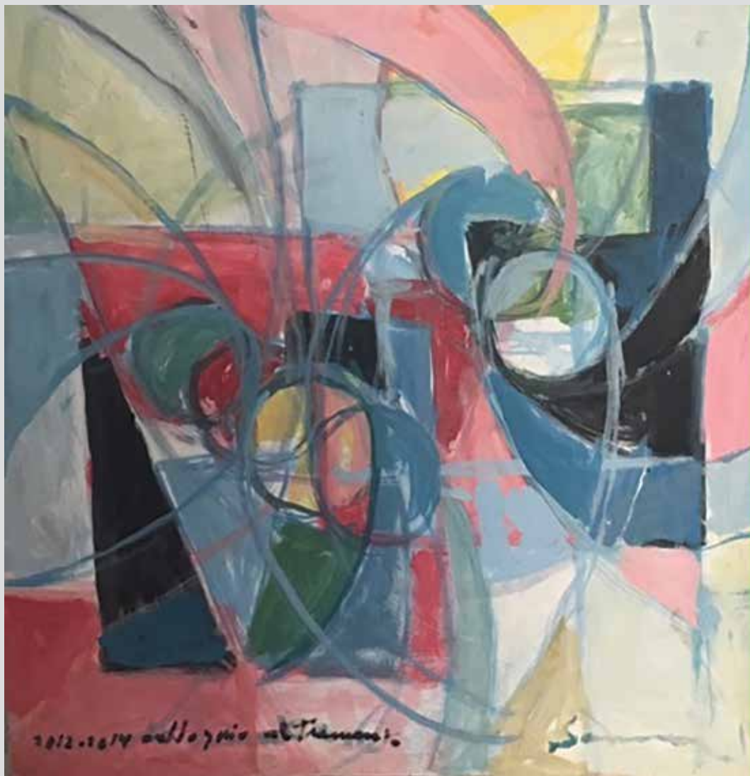
Eksperimentalno slikarstvo, Razgovor u sumrak / Pittura Sperimentale Colloquio al tramonto, 2012 – 2014, 47 x 70