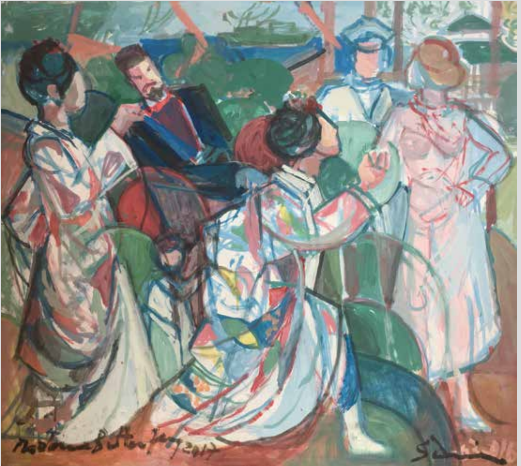
Madam Baterflaj / Madama Butterfly, 2017, 70 x 80