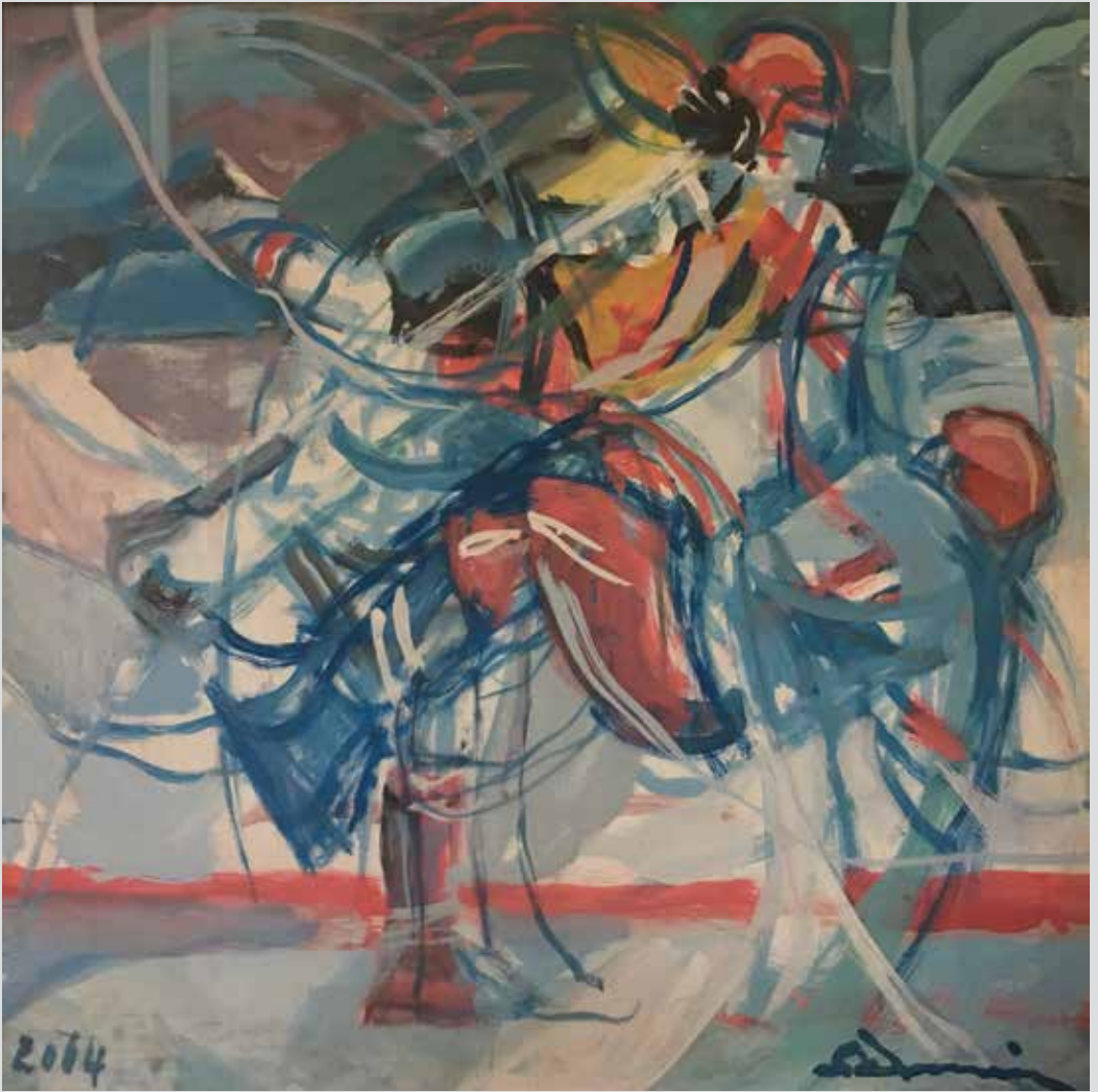
Hokej na ledu / Hockey su ghiaccio, 2014, 40 x 44