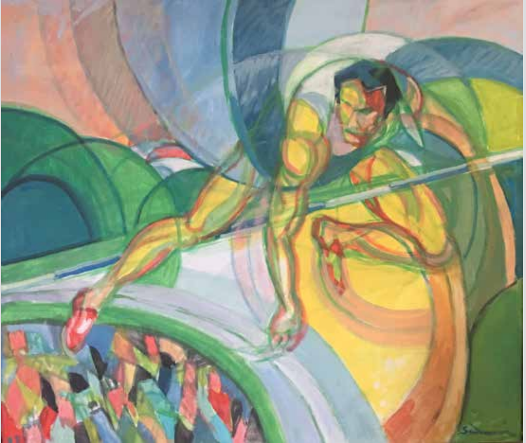
Skok u vis / Saut en hauteur, 1999, 70 x 60