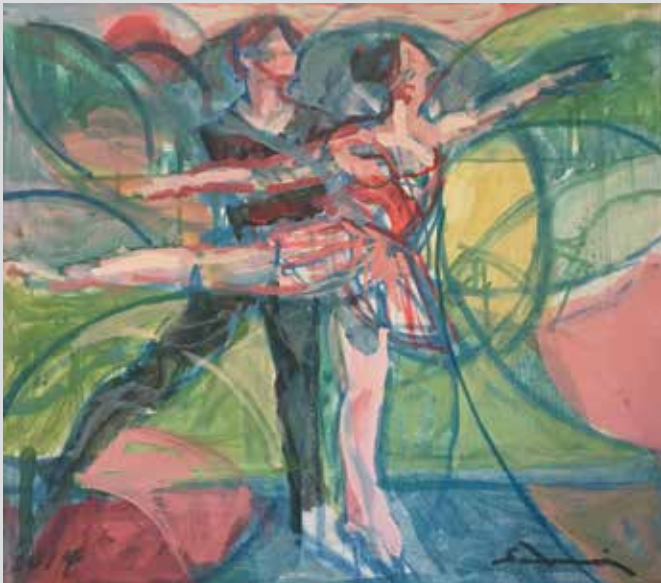
Omaž Karli Frači / Omaggio a Carla Fracci, 2014, 38 x 42